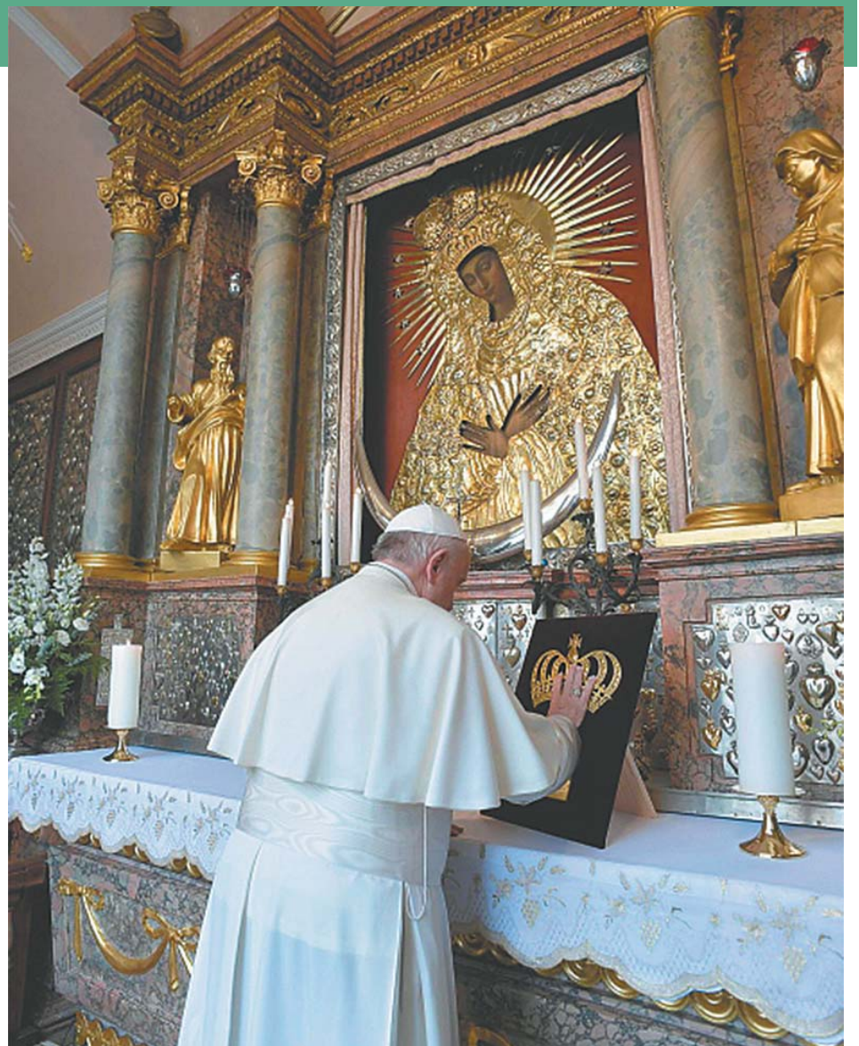
Popiežius ir tikinčiųjų minios meldžiasi nebyliai betono ar medžio skulptūrai. Nepadės.

Marija būdama gyva jokių stebuklų nėra padariusi. Netgi Kanos vestuvėse prašė savo sūnaus Kristaus, kad parūpintų gėrimo. Svečiai jo pritrūko. Jis vandenį pavertė šviežių vaisių vynu (sultimis). Šiandien keista, kad Marija, vietoje Kristaus, liko tarpininke, suteikia malones... Ji garbinama ir meldžiamasi jai. Kai kurie maldininkai prašo iš „šventųjų“, paveikslų, skulptūrų, popiežių... malonių. Laikinai velnias apgaudinėja juos, suteikia ir išpildo norus. Vėliau pra-