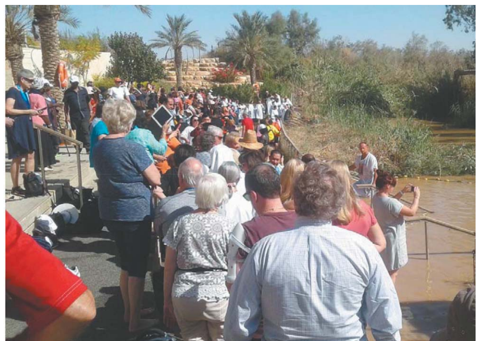
Krikštas Jordano upėje

gesinti skandalus ir atsiprašinėti nuskriaustųjų viso pasaulio žemynuose pedofilijos skandaluose, vietoj to, kad panaikinti savo bendruomenės vadovų išleistus klaidingus įstatymus?